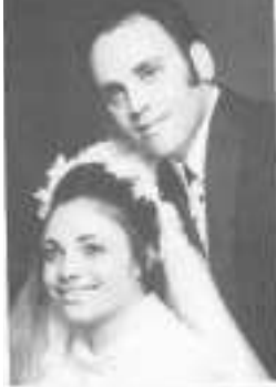
סור וסורול (כור) סול סורול - 12 אקוס 1971 Natal and Anisab Rosta) Dool Jovanovic - Aug. 12, 1971