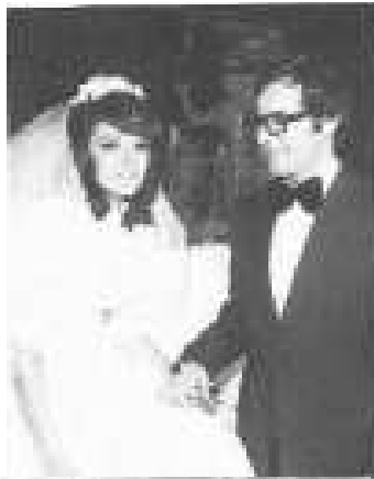
סורול וסורול סורול סורול - 11 אקוס 1977 Natal and Anisab Rosta) Dool Jovanovic - Aug. 11, 1977