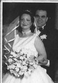
لیلی و هرصل نامدار هانتینگتون هیلتون نیویورک - ۲۸ می ۱۹۹۸ Lili and Hosni Nandee Huntington Hotel - New York May 28, 1998

خبرهای اسرائیل و نیای یهود * جشن های چهل و هشتمین سالگرد یکپارچگی شرق و غرب اورشلیم شامگاه روز یکشنبه با راه پیمایی پرچمداران و مراسم مردمی از غرب به کوی و برزن های شرق اورشلیم به اوج رسید. صدها نفر راه پیمایان که پرچم اسرائیل و پرچم شهر اورشلیم را به دست داشتند در حالی که افراد پلیس و انتظامی از آن ها حفاظت می کردند، از دروازه «یافو» وارد بخش قدیمی شهر شدند. روز یکشنبه با چهل و هشتمین سالروز یکپارچه شدن شهر اورشلیم مصادف بود؛ مناسبتی که طبق تقویم عبری، یادآور سالروز جنگ شش روزه سال ۱۹۶۷ است. از هنگام جنگ استقلال اسرائیل در ۶۷ سال پیش تا نوزده سال پس از آن، بخش شرقی اورشلیم در تسلط دولت و ارتش اردن قرار داشت و مردم اسرائیل اجازه نداشتند به آن جا رفت و آمد کنند. دولت اردن در آن سالها ورود یهودیان غیر اسرائیلی را به محوطه «دیوار ندبه» (کتل همعراوی) در شرق اورشلیم نیز ممنوع ساخته بود. ** صدها نفر عرب فلسطینی یکشنبه شب در کوچه های شهر قدیمی و در دروازه ورودی آن اجتماع کرده و با به اهتزاز درآوردن پرچم فلسطین به ورود یهودیان به بخش شرقی شهر اعتراض کرده و شعار