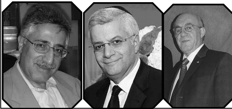
The Shalom Week Team:

این بحث های جدید درباره همکاری ایران و آمریکا در خصوص داعش در حالی مطرح شده است که روزنامه آمریکایی نیویورک تایمز روز شنبه گزارش کرد که مقامات آمریکایی پیشنهاد جدیدی را به ایران مطرح کرده اند که طبق آن، اتصال بخشی از ۱۹ هزار سانتریفیوژ ایران قطع شود.