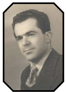
Who is this well-known person? see inside