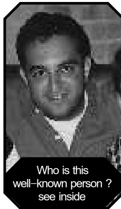
Who is this well-known person? see inside