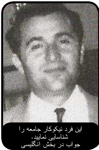
این فرد نیکوکار جامعه را شناسایی نمائید. جواب در بخش انگلیسی

برای پیشگیری در مقابل حملات هوایی، موشکی و بمباران، یک بیمارستان با تمام تجهیزات به زیر زمین برده می شود. این بیمارستان واقع در شهر حیفا در شمال اسرائیل با ظرفیت دو هزار تخت در زمان جنگ، یک پارکینگ با گنجایش هزار و پانصد خودرو در زمان صلح و یا شرایط عادی است.